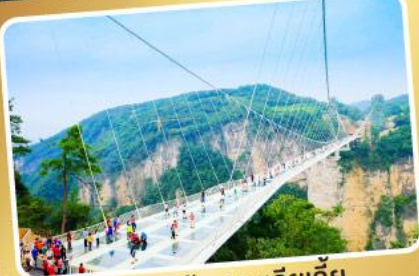
สะพานแกว่ง ฉางเจียเจีย