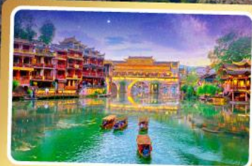
เมืองโบราณเฟิงหวง